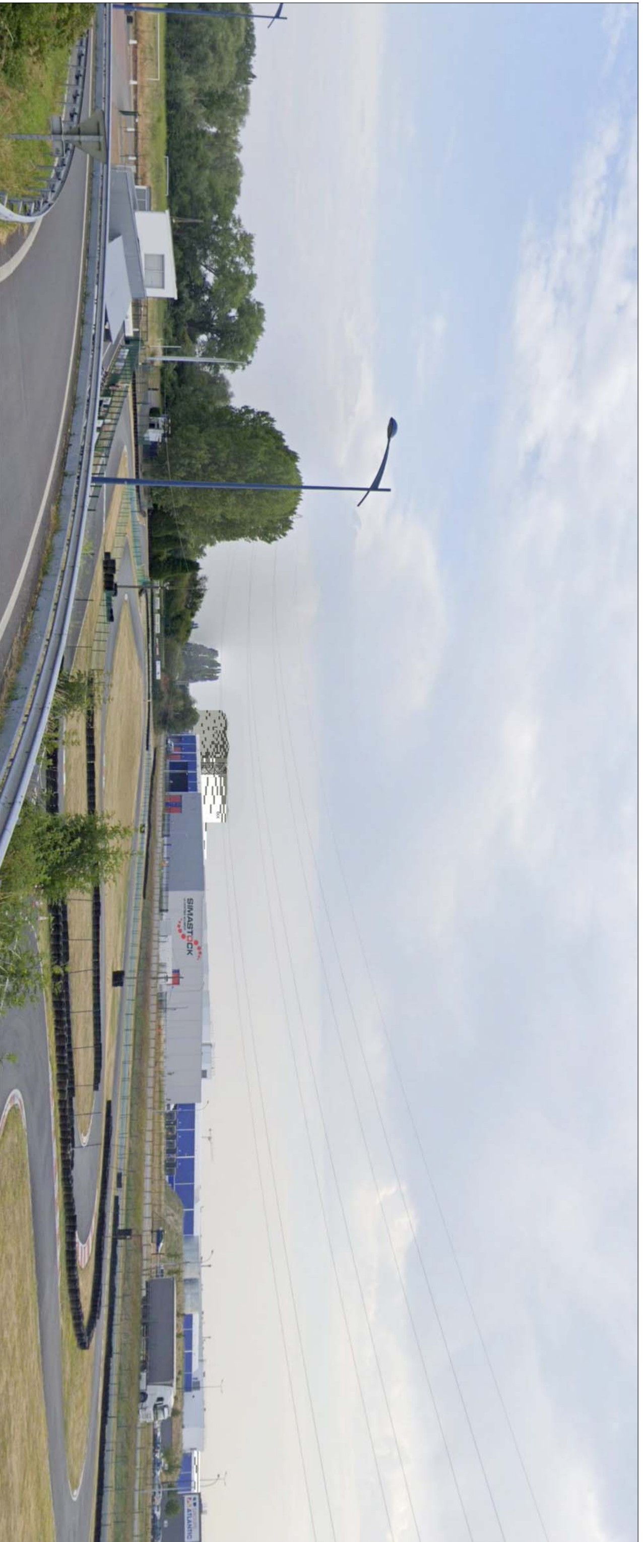
VUE DEPUIS L'ACCES AU BOULEVARD SUD DEPUIS LA RN 47 - ETAT PROJETE